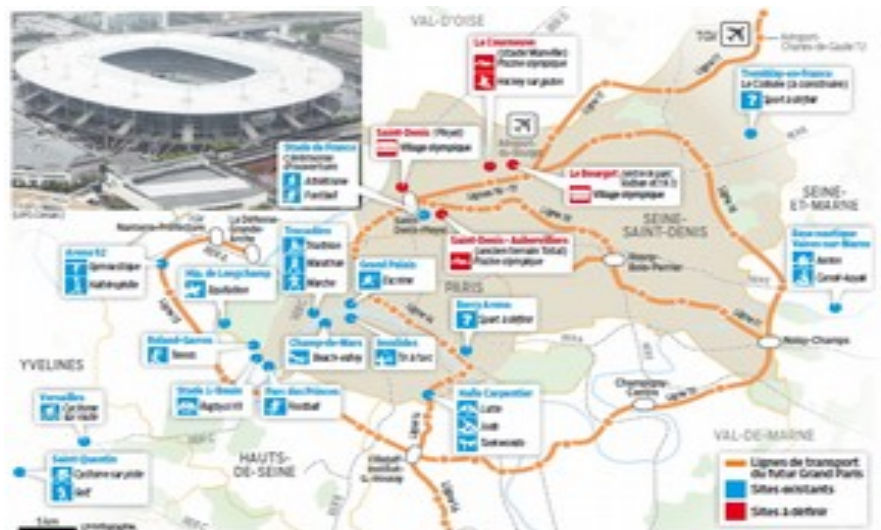
(voici une carte de Paris)

Groupe C : L'Allemagne, L'Irlande du Nord, La République Tchèque, La Norvège, L'Azerbaïdjan, Le Saint-Marin etc.